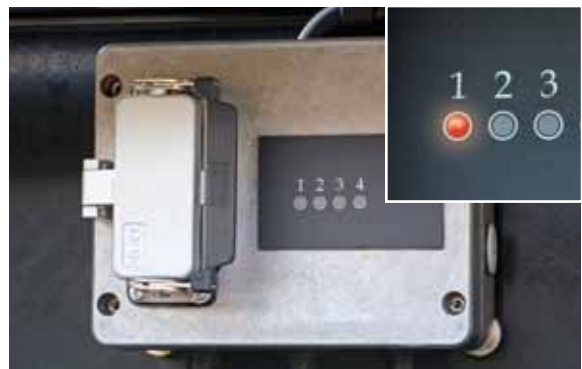
Светодиодный индикатор контроля нагревательных стержней