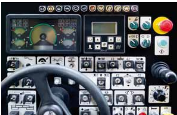
Операторский пульт управления с одиночными переключателями