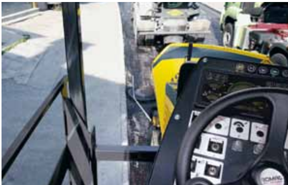
Видимость референсного объекта