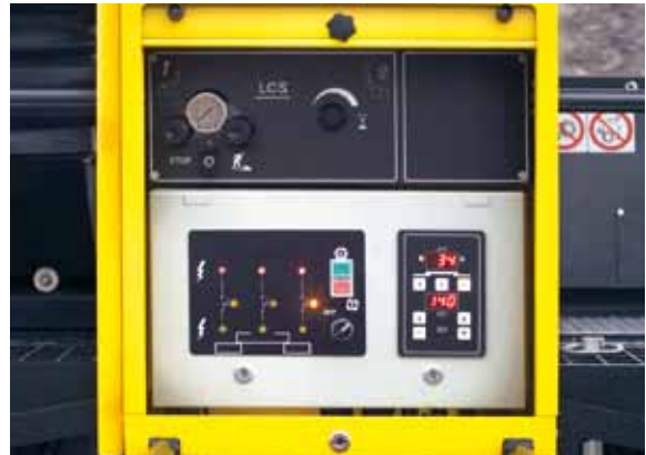
Центральный блок управления плитой