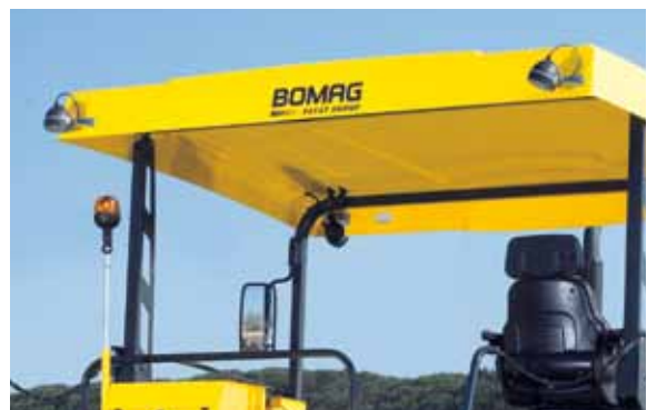
Серийное круговое освещение