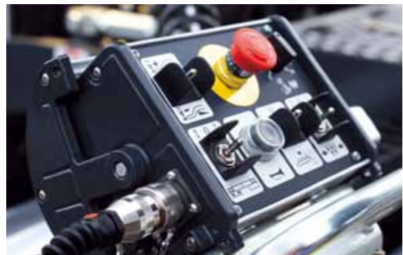
Боковой пульт управления плитой